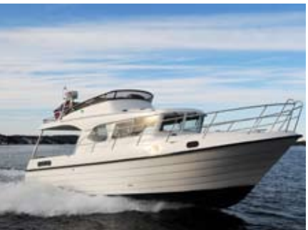
SOL: Viknes 1030 Sunbridge.